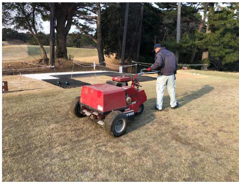
グリーンセアによる TEEエアレーション