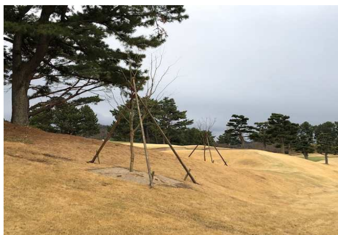
No.9レディスティ左前 イロハ紅葉