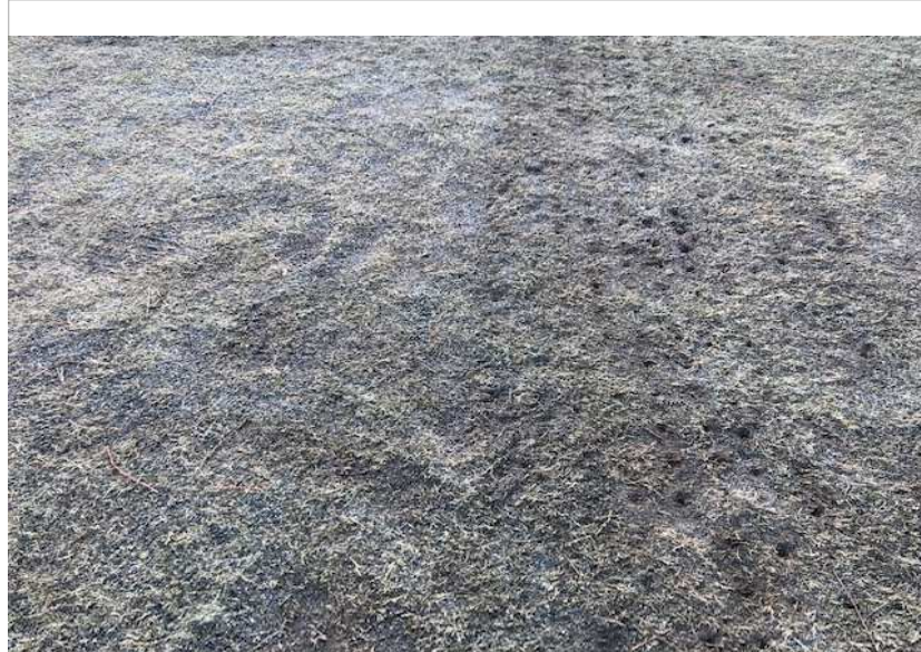
左 作業前 右 作業後