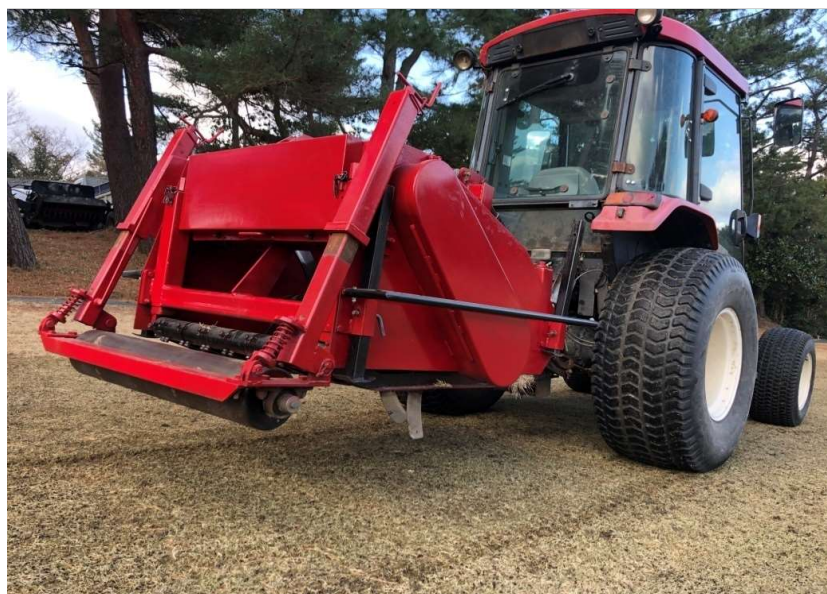
グラウンドブレイカー