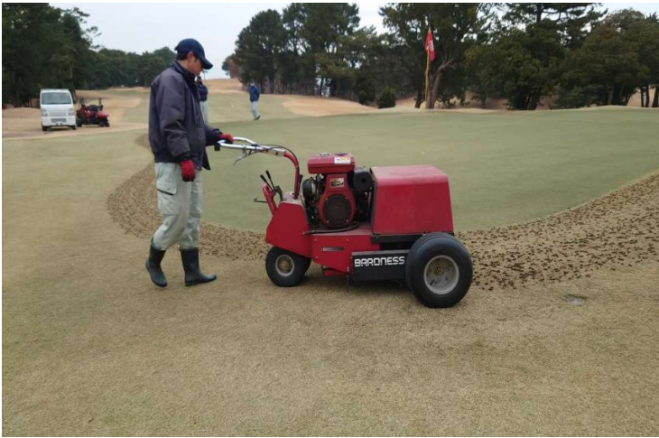
グリーンセアによるコアリング