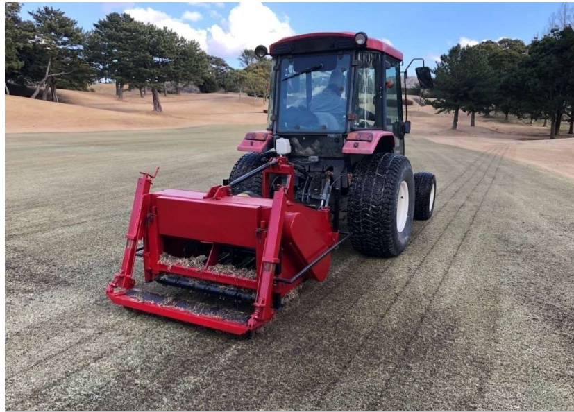
グラウンドブレイカー作業 傾斜に沿って切れ込みを入れる

100mm前後の深さで切り込みを入れ土壌の固結・排水の改善を促し、病原菌・雑草の発生を抑制する