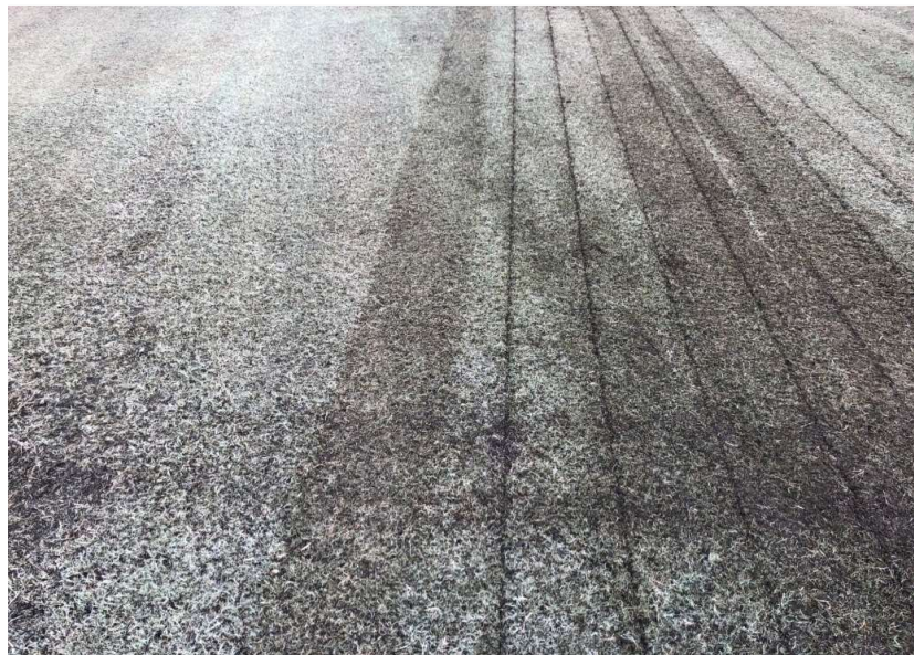
作業前(左) 作業後(右)